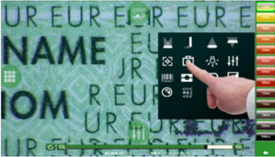
全新飞指式触摸控制操作界面，易于操作，方便快捷