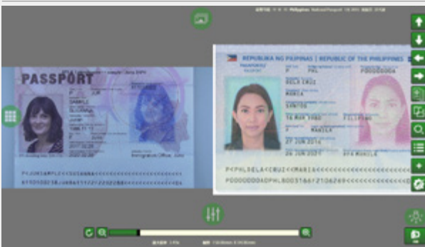
OVD 激光全息光源，检验激光全息膜等图像

LED 侧光源照射，揭示凹凸版印刷、钢印、物理刮痕等，并配合红外光源，剔除背景干扰